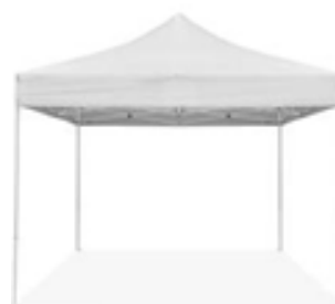
3/ Stands parapluie