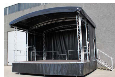
10/ Scène mobile (nouvelle)