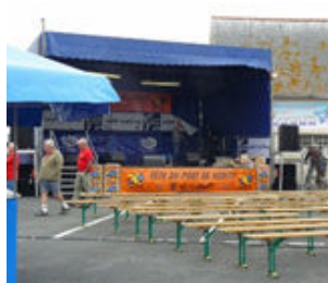
9/ Scène mobile (ancienne)