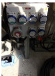
5/ Coffrets électriques