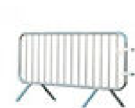
7/ Barrières Vauban